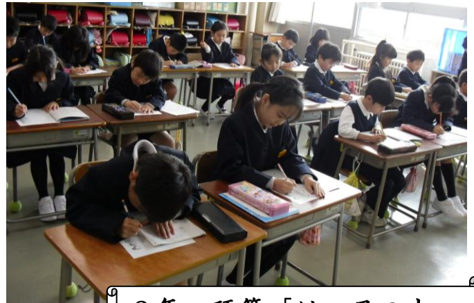
2年 硬筆「はつ日の出」